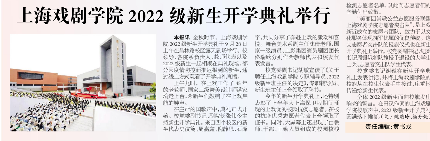
上海戏剧学院2022级新生开学典礼举行

刘江教授结合今年十月即将召开的党的二十大，重点从深刻理解和把握第四卷出版的历史背景与重大意义、系统把握第四卷的总体框架和主要特色，以及在实践中贯彻落实好新思想等三个方面，对《习近平谈治国理政》第四卷进行了详细的阐释和深入的解读。